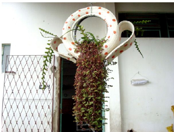
Imagem 10: Xaxim de material reciclado trabalhado artisticamente

No trabalho ecológico da escola, as crianças usam sua criatividade com sucata para embelezar o ambiente onde ficam as plantas. Este está inserido nos interesses manuais, por ser feito através da manipulação em sua forma plena (DUMAZEDIER, 1980). Como também é notável a falta de reforma ou manutenção na escola, como pintura, os alunos foram convidados a usar sua imaginação e expressar sua criatividade em paredes da escola na prática dos interesses artísticos, gerando encantamento, mostra uma sensação de quem o produz, universo estético feito de imagens e emoções, de sentimentos e imaginário (DUMAZEDIER, 1980).